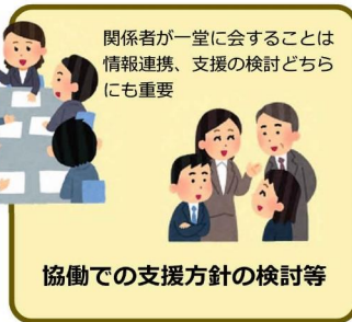
協働での支援方針の検討等