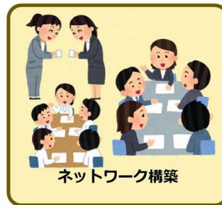
ネットワーク構築