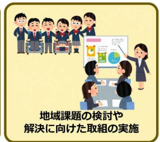
地域課題の検討や解決に向けた取組の実施